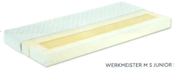
WERKMEISTER M S JUNIOR 2